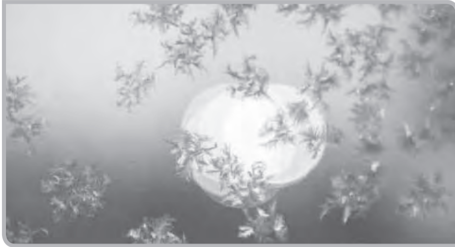
أشعة القمر فقد أعاد الخالق تسميتها بالنور. مصادر الضوء تنقسم مصادر الضوء علميا عادة إلى نوعين: مصادر مباشرة كالشمس والنجوم والمصباح والشعلة وغيرها، ومصادر غير مباشرة كالقمر والكواكب.

قال تعالى: { هو الذي جعل الشمس ضياء والقمر نورا } يونس: 5، فرق العليم الخبير في الآية الكريمة بين أشعة الشمس والقمر فسمى الأولى ضياء والثانية نورا. وإذا نحن بحثنا في قاموس عصري ما وجدنا جوابا شافيا للفرق بين الضوء الذي هو أصل الضياء والنور، ولوجدنا أن تعريف الضوء هو النور الذي تترك به حاسة البصر المواد. الفرق بين النور والضوء إذا بحثنا عن معنى النور وجدنا أن النور أصله من نار ينور نورا أي أضواء. فالكثير القواميس لا تفرق بين الضوء والنور بل تعتبرهما مرادفين لمعنى واحد. ولكن الخالق سبحانه وتعالى فرق بينهما فهل يوجد سبب علمي لذلك؟ دعنا نستعرض بعض الآيات الأخرى التي تذكر أشعة الشمس والقمر، فمثلا: في الآيتين التاليتين (وَجَعَلَ الْقَمَرَ فِيهِنَّ نُورًا وَجَعَلَ الشَّمْسُ سِرَاجًا) (وبيننا فوقكم سُبُعا شُدَادًا * وَجَعَلْنَا سِرَاجًا وَهَاجًا) نجد أن الله سبحانه وتعالى شبه الشمس مرة بالسراج وأخرى بالسراج الوهاج والسراج هو المصباح الذي يضيء إما بالزيت أو بالكهرباء، أما