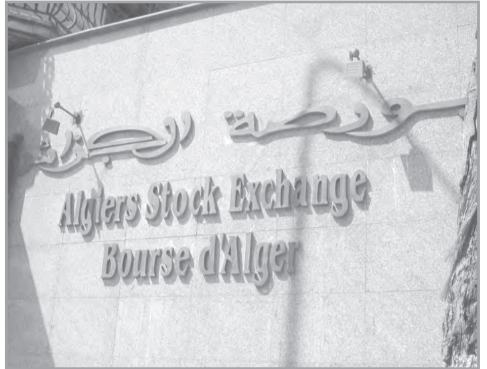
سجلت بورصة الجزائر أكبر الارتفاعات المحققة على صعيد مؤشرات الأداء على مستوى البورصات العربية خلال الثلاثي الأول من عام 2023، بعد أن بلغت نسبة 14 بالمائة مقارنة بالثلاثي الأخير من السنة الماضية، وفقا لصندوق النقد العربي. وذكر الصندوق في نشرته الفصلية لأداء أسواق

الأوراق المالية العربية للثلاثي الأول من 2023 الصادرة أول أمس الجمعة، أن بورصة الجزائر "تصدرت أكبر الارتفاعات المحققة على صعيد مؤشرات الأداء على مستوى البورصات العربية خلال الربع الأول من عام 2023 بنسبة 14 بالمائة". وعلى أساس سنوي، سجل مؤشر صندوق النقد العربي الخاص ببورصة الجزائر، حسب المصدر ذاته، ارتفاع مؤشر البورصة بنسبة 16,9 بالمائة في نهاية الثلاثي الأول من 2023. كما سجل المؤشر الرئيس لبورصة الجزائر ارتفاعا بنسبة 17,1 بالمائة، ليغلق عند مستوى 3646,5 نقطة في نهاية مارس من 2023. وفيما يتعلق بالقيمة السوقية، فقد سجلت بورصة الجزائر ارتفاعا بنحو 84,7 مليون دولار، لتصل إلى نحو 572,6 مليون دولار مع نهاية الثلاثي الأول من السنة الجارية، مقابل 487,9 مليون دولار خلال الثلاثي الأخيرة من السنة الماضية. لتكون بذلك من بين البورصات العربية التسع التي سجلت ارتفاعا في القيمة السوقية خلال الثلاثي الأول، فيما سجلت سبع بورصات عربية أخرى تراجعا في قيمتها السوقية. أما بالنسبة لنشاط التداول في بورصة الجزائر، فقد شهد هو الآخر ارتفاعا خلال نفس الفترة، حيث ارتفعت قيمة الأسهم المتداولة لتبلغ نحو 311 ألف دولار، مقارنة مع 196,2 ألف دولار خلال الثلاثي الأخير من 2022. وارتفع أيضا عدد الأسهم المتداولة إلى نحو 65,5 ألف سهم، مقابل نحو 52,2 ألف سهم تم تداولها خلال الثلاثي الأخير من السنة الماضية، لتكون بورصة الجزائر من بين سبع بورصات عربية سجلت ارتفاعا في عدد الأسهم المتداولة.